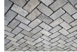
ΣΧΕΔΙΟ ΤΟΠΟΘΕΤΗΣΗΣ ΚΥΒΩΛΙΘΝ