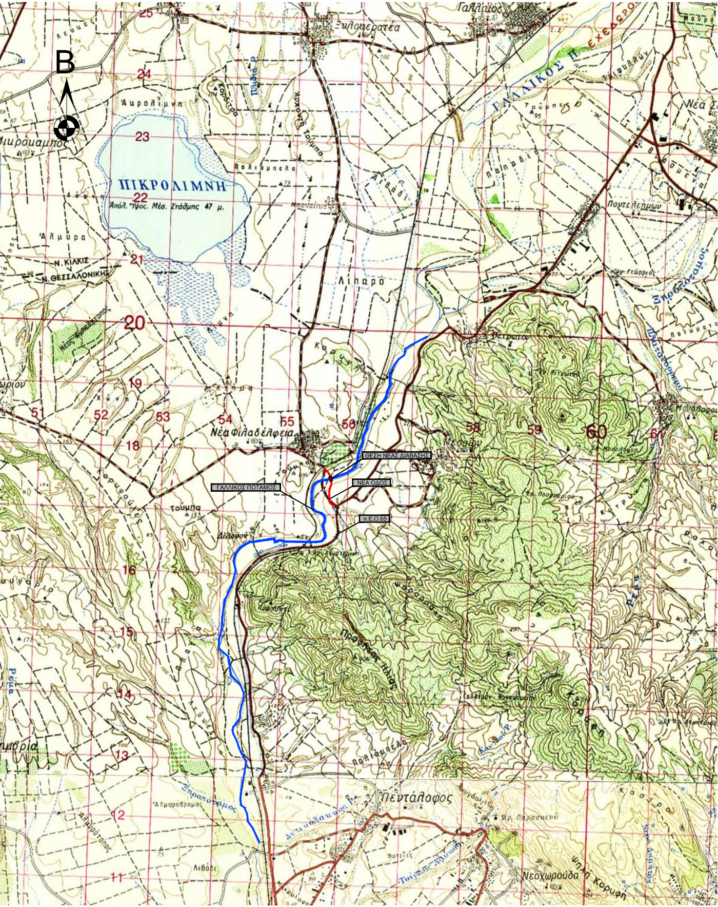
ΥΠΟΒΑΘΡΟ: ΑΠΟΣΠΑΣΜΑ Φ.Χ. "ΘΕΣΣΑΛΟΝΙΚΗ" & "ΚΙΛΚΙΣ" /1:50.000/ Γ.Υ.Σ.